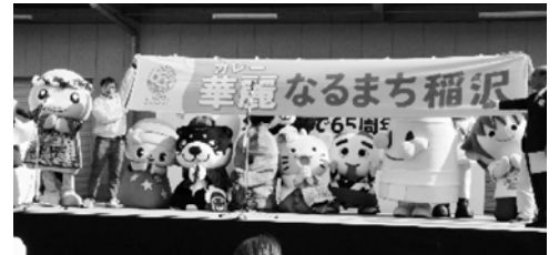
(写真は昨年度開催したカレーフェスティバルの様子)

11月3日(日)に稲沢市役所駐車場にて『稲沢カレーフェスティバル2024』を開催します。市内27店舗が集結し、「カレー×稲沢らしさ」をテーマに自慢のカレー料理をお値打ち(ワンコイン)に提供します。またステージでは、いなっピーの仲間たち全12体のステージショーや稲沢市観光PR大使「はやたく」作詞作曲のカレーの歌(カレイノリ)を初披露します。